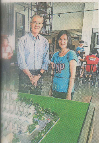
城市的陈良慧成为Andira Park